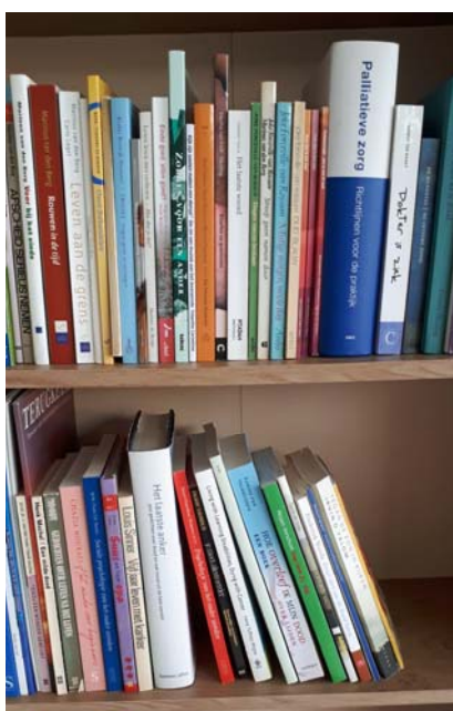
Boeken van VPTZ Midden Gelderland staan bij elkaar op één locatie.